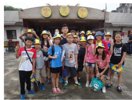
六甲：老梅廟宇踏查