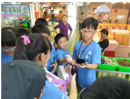
五甲：參觀富基漁港觀光魚市