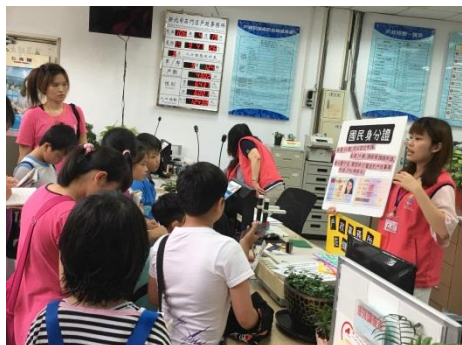
四甲：參觀戶政事務所