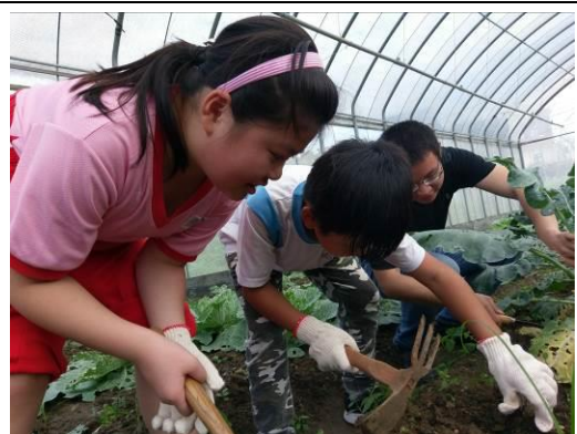
學生整理採收過後的農地。