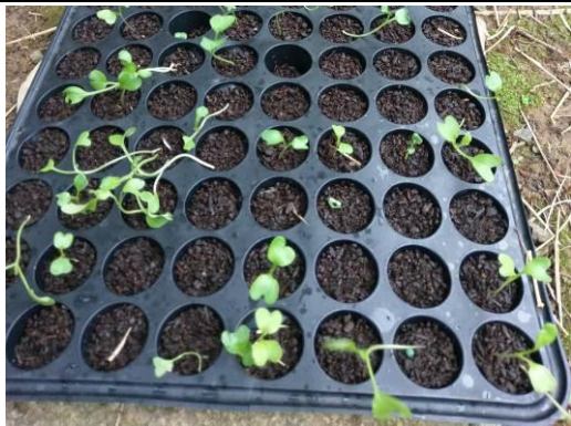
學生悉心照顧後發芽的菜苗