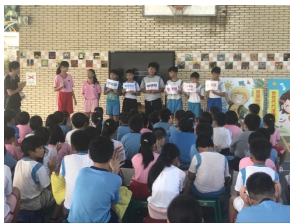
環保小局長運用兒童朝會進行資源分類回收的宣導