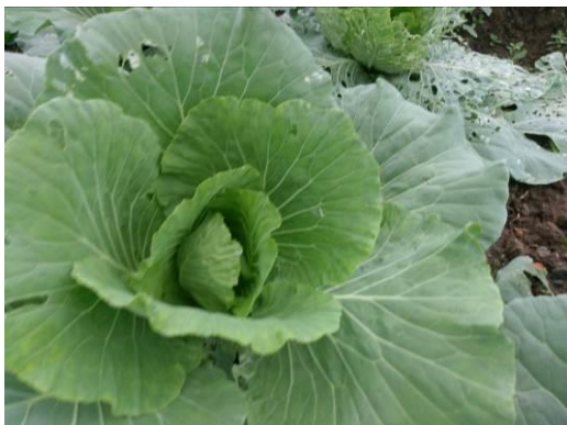
講師帶領孩子觀察蔬菜生長情況，並討論如何幫助蔬菜成長。