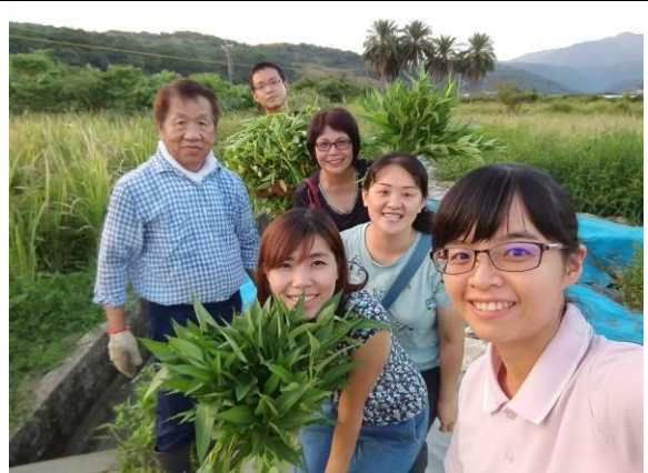
教師同仁在農場主人的帶領下，對於有機、無毒農業教育建立基礎概念。