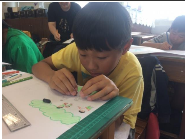
學生上課——地圖書繪本製作