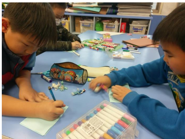
學生上課——《我的家》小書製作