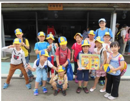
二甲：老梅牽罟寮導覽