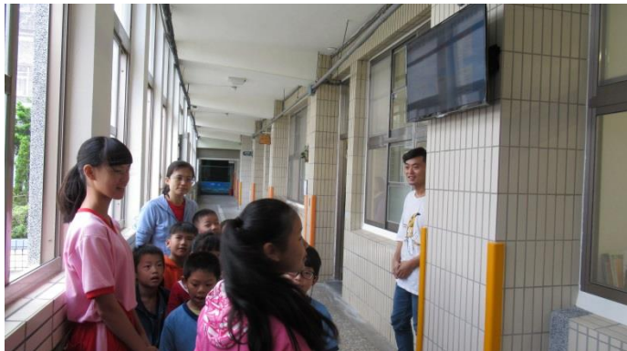
環保小局長解釋本校智慧電錶的功能