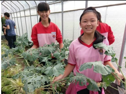
學生採收可收成的大青菜。