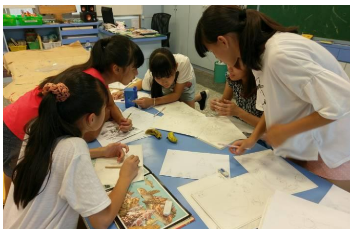
學校藝文教師帶領學生進行海洋繪本創作