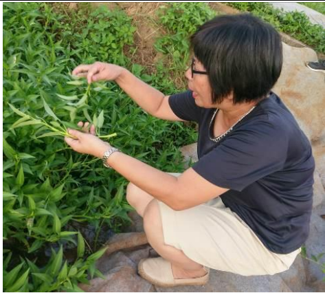
教師前往鄰近有機農場觀摩農作物培育及照顧之方式。