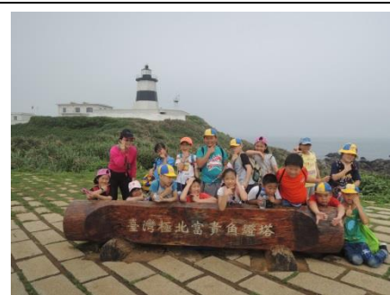
三甲：走訪富貴角燈塔步道