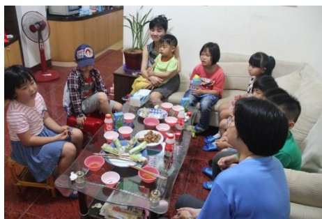
一甲：參觀老梅的同學家