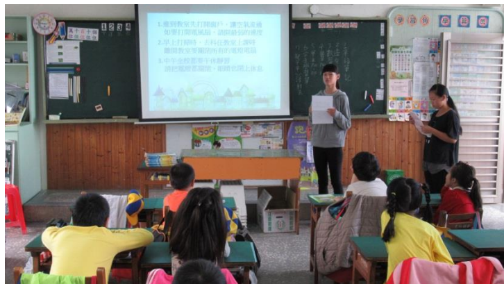
環保小局長到各班進行節電按個讚的說明