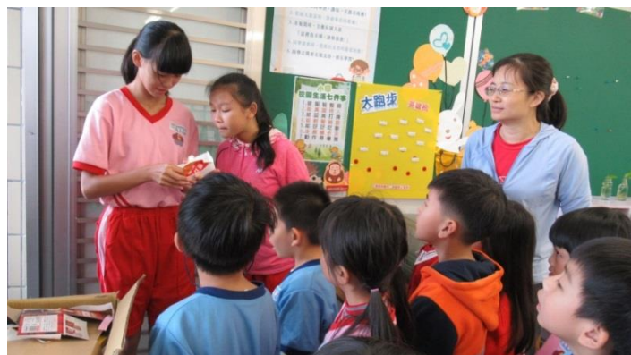
環保小局長至各班檢視資源回收的狀況