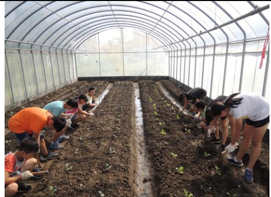
學生合力將菜苗移植到網室中。