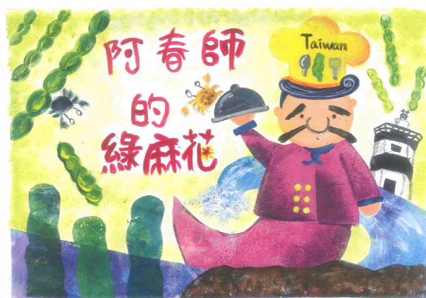
老梅國小海洋繪本-阿春師的綠麻花