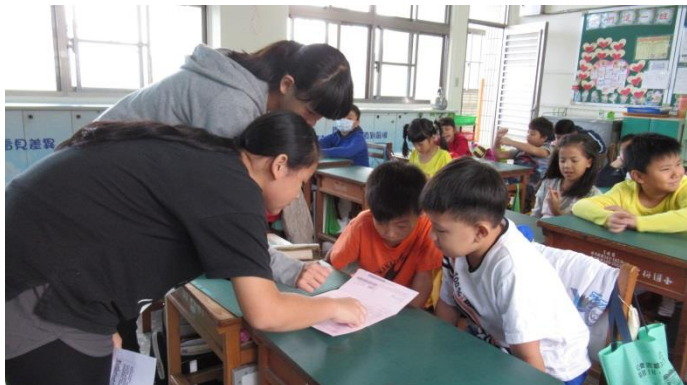
環保小局長指導低年級學生如何觀看電費單