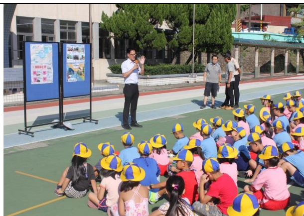
兒童朝會宣導節能觀念