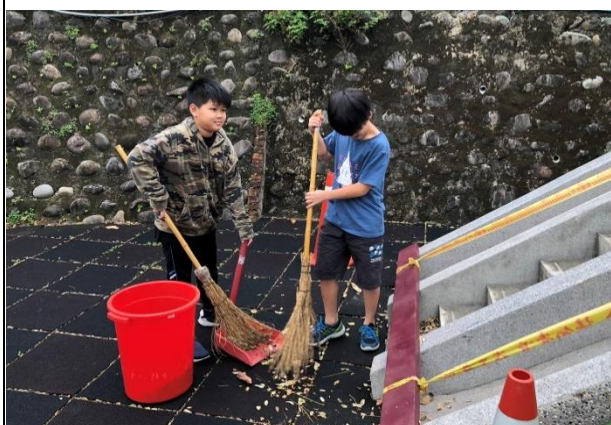
環保小局長示範校園環境清潔