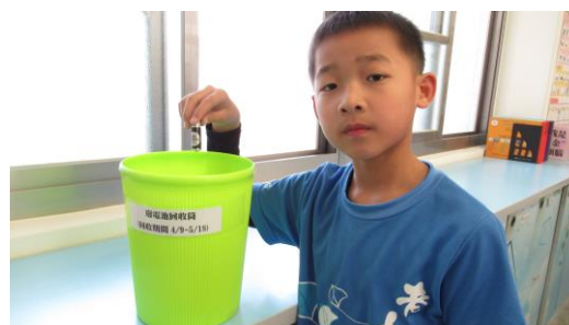
廢電池回收宣導活動