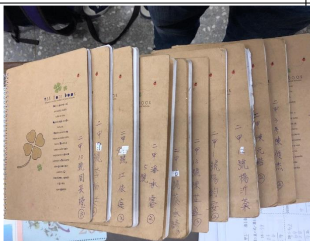
提供筆記本供學生紀錄節電心得