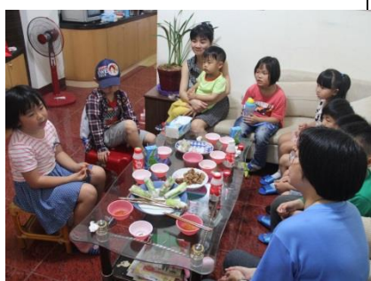
一甲：參觀老梅的同學家