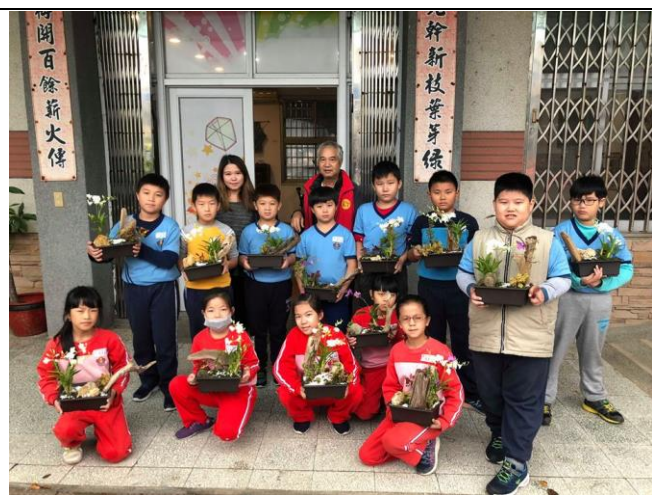
在地花卉專家指導學生組合盆栽，美化環境