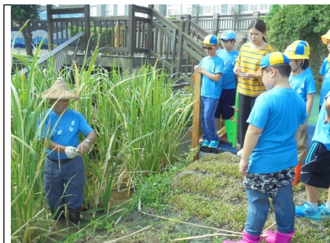
邀請社區農業專家指導筴白筍生態