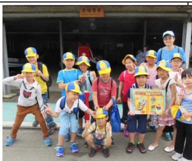
二甲：老梅牽罟寮導覽