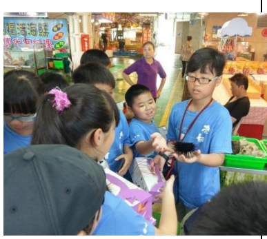
五甲：參觀富基漁港