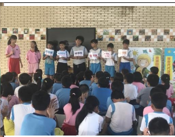
兒童朝會播放資源回收宣導短片