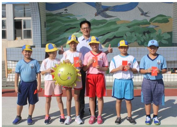
兒童朝會獎勵節能績優班級