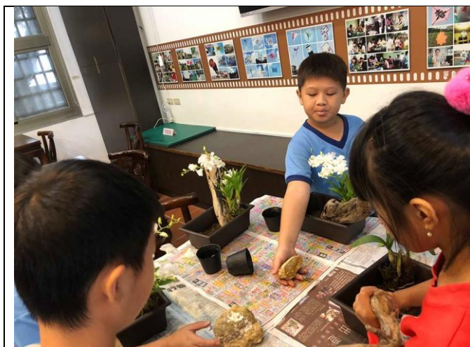
學生在專家指導下進行盆栽組合