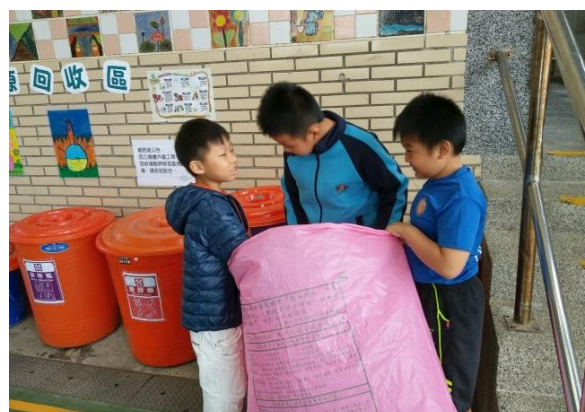
學生使用垃圾袋整理垃圾