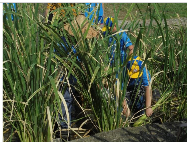
學生親自體驗採收筴白筍過程