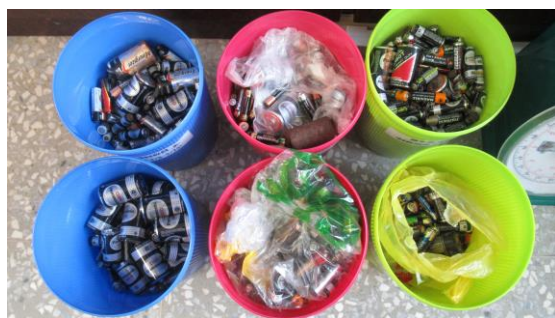
廢電池回收籃及廢電池回收成果