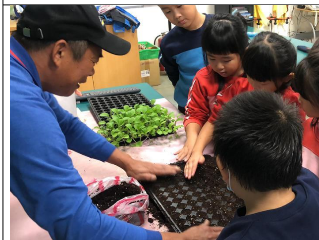
在地有機認證農友入校進行蔬菜育苗指導