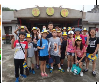
六甲：老梅廟宇踏查