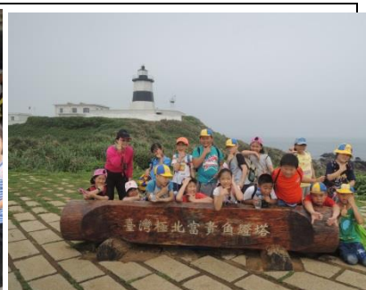
三甲：走訪富貴角燈塔步道