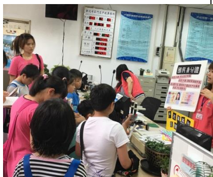
四甲：參觀戶政事務所