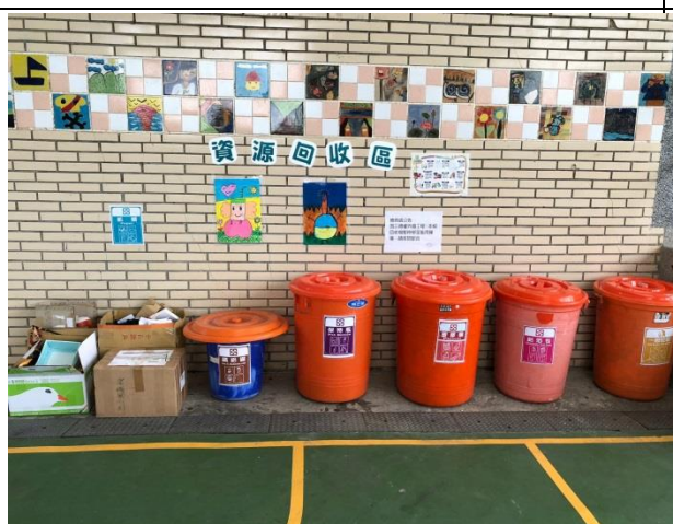
設置資源回收分類桶並進行情境布置