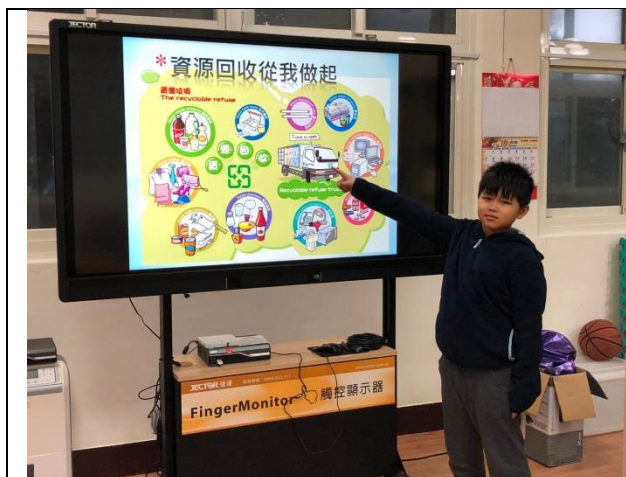
環保小局長進行資源回收知識宣導