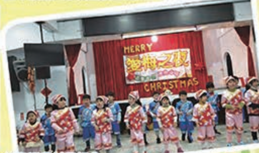
幼兒園農村風組曲