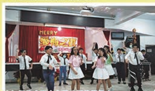
六年級的少男少女是我們的偶像