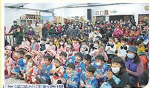
人氣滿滿的活動會場