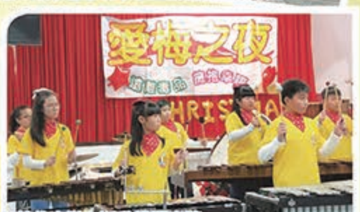
打擊代表隊為活動揭開序幕