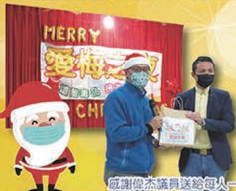
感謝傑出議員送給每人一個聖誕口罩

老梅一年當中最熱鬧的夜晚莫屬愛梅之夜了！這個晚上有許多關心學校的家長、貴賓來到老人活動中心，看可愛又活潑的小梅寶貝賣力演出，相信到場的大人們絕對會大為讚嘆和不虛此行！親身感受到充滿愛與感恩的夜晚，已在 2020 年末畫下完美句點，期待明年的愛梅之夜與您再次相見！