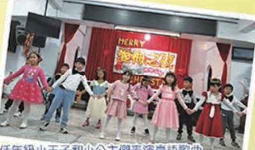
低年級小王子和小公主們表演臺語歌曲