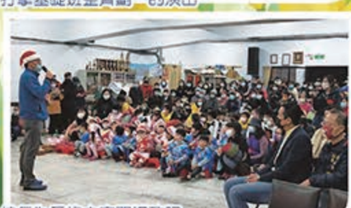
校長為愛梅之夜開場致詞