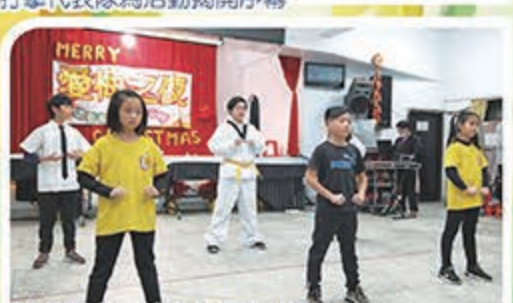
跆拳道社的表演真是精神抖擻