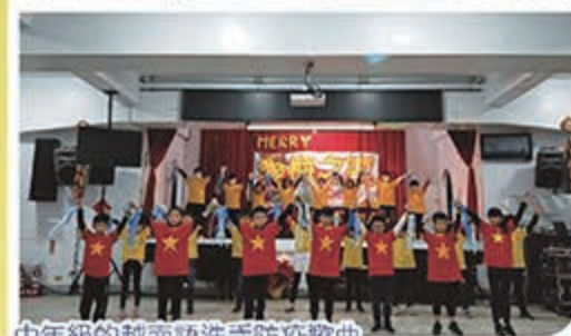
中年級的越南語洗手防疫歌曲