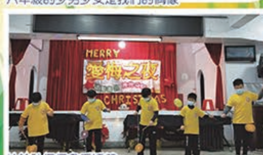
扯鈴社個個身手矯健