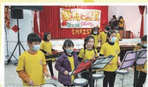
打擊基礎班整齊劃一的演出