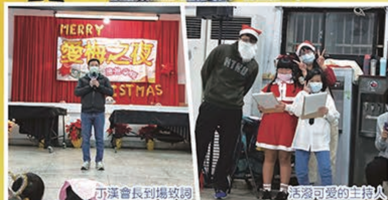
丁漢會長到場致詞