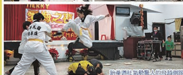
跆拳道社氣勢驚人的飛越側踢