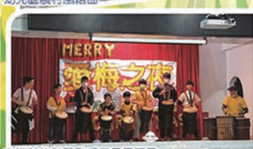
非洲鼓的鼓聲動感又具異國風