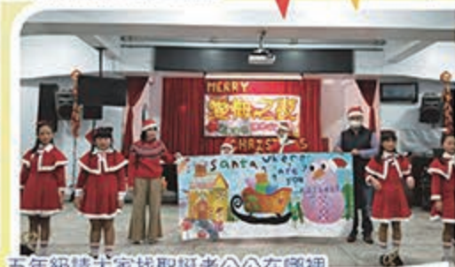
五年級請大家找聖誕老公公在哪裡